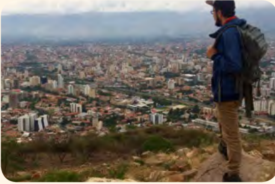
Cochabamba : Den Bléck iwwert d'Staat vun Cochabamba vum Cristo aus gesin.

belge vivant à Cochabamba, le marché de la Cancha. Ce marché, qui est le plus grand de toute l'Amérique Latine, offre tout de ce dont on a besoin pour vivre en Bolivie : fruits et légumes, jouets et instruments de musique, animaux vivants et fétus de lamas séchés (oui vous avez bien lu...), feuilles de coca et artisanat local, téléviseurs et frigos, vêtements et chaussures, des restaurants, des salons de coiffure, des cabinets de consultation médicale, des tatoueurs, etc. etc. etc. Il faut vraiment l'avoir vécu,