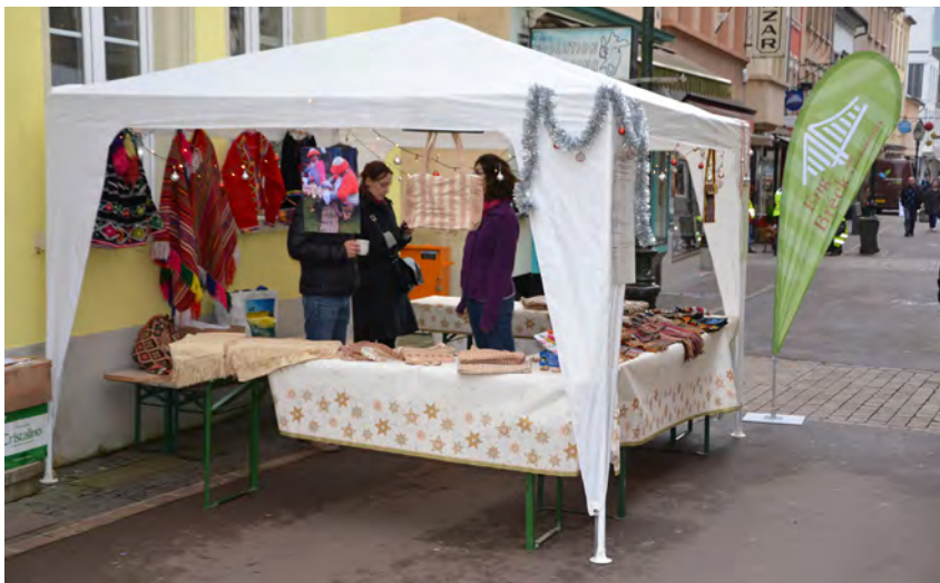
Eise Stand um Chrëstmaart 2015 zu Dikrich

Mat Hëllef vum QR-Code, den der hei niewendru fannt, ass et och méiglech iwer DIGICASH en Don op de Kont vun der “Eng Bréck mat Lateinamerika” ze maachen.