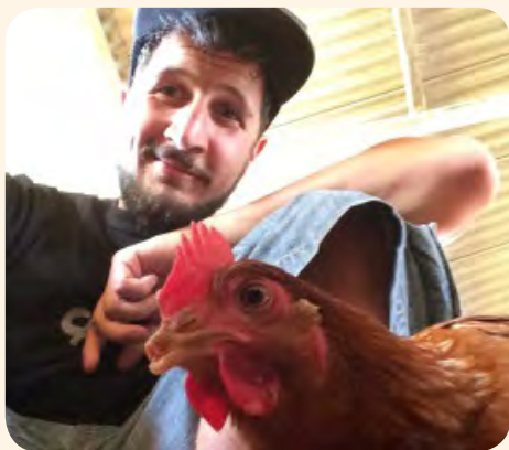
Ma poule : Selfie-photobomb während dem Emzuch vun den 600 Hinger an hiert neit Doheem

À côté du CAM, nous trouvons aussi le Centro Infantil (CI) où les enfants des femmes peuvent passer la journée sous la protection d'une équipe d'éducateurs et de psychologues. L'objectif du Centro Infantil est de proposer une structure où les enfants peuvent vivre comme tels. La vie de ces derniers est caractérisée par des moments de tristesse, de violence et d'angoisse et l'équipe pédagogique s'efforce chaque jour à leur permettre de vivre une enfance normale.