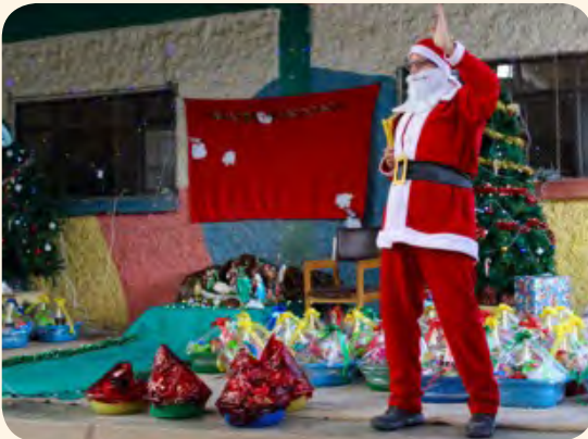
Fiesta de Navidad : Dest Joer dueft ech op der Kreschtfeier Den Papá Noel fir d'Mammen en an hier Kanner sin.

La semaine d'après je me suis présenté à mon futur lieu de travail : La Casa de Atención a la Mujer (CAM). Il s'agit d'une maison d'accueil pour femmes qui ont souffert de violence conjugale. Cette problématique est très courante en